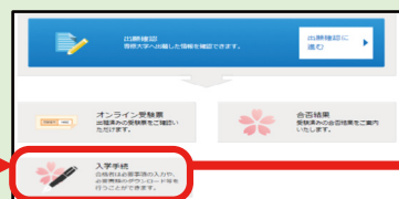
マイページ内の「入学手続」をクリック