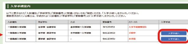
手続をとる項目の「入学手続」をクリック