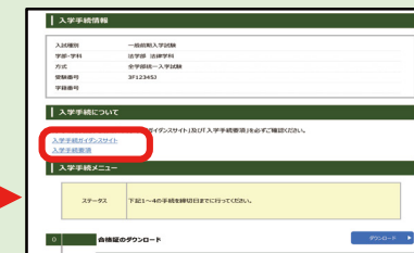
「入学手続ガイダンスサイト」および「入学手続要項」で、手続の詳細を確認してください

入学希望者が、入学手続を完了するためには、(1)から(3)のとおり、入学手続期限日までに「学費（完納または分納1期分）の振込」「入学手続書類の郵送」「入学手続に必要な情報の登録」を行ってください。郵送は入学手続期限日までの消印があるものを有効とします。なお、期日までに入学手続もしくは入学手続延期をしない場合は、入学を辞退したものとみなします。